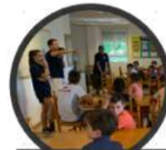
Orden y limpieza